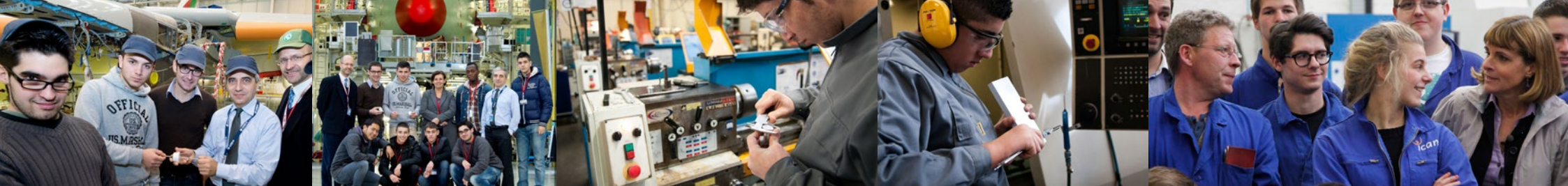
Photos de gauche à droite : [1] & [2] : l'école de production de Toulouse visite les ateliers Airbus, [3] & [4] : dans l'atelier de l'école de production de Toulouse [5] : Anne Lauvergeon en visite à l'Ecole de production de Lille