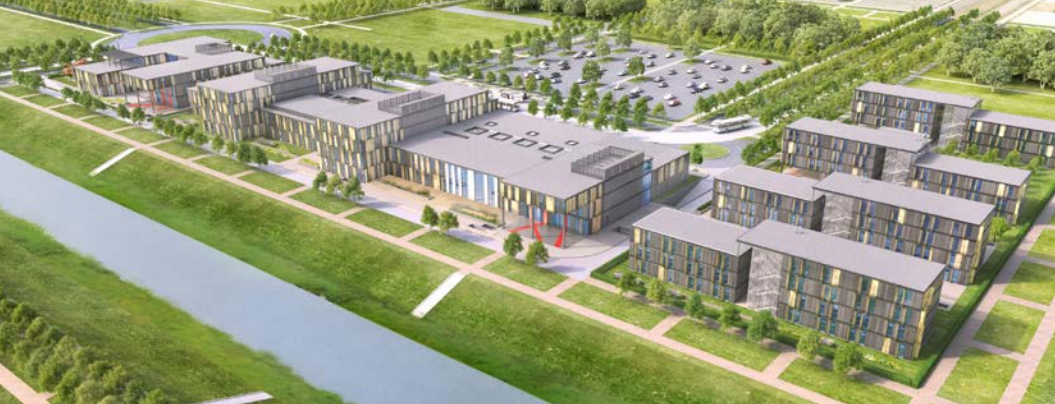
Le futur campus Icam site de Paris Sénart (Photo non contractuelle)