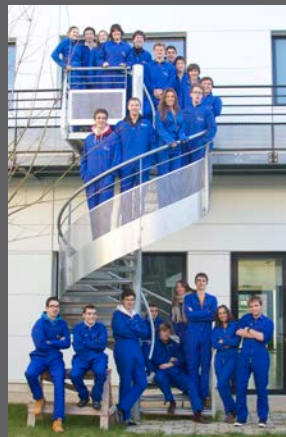
La première promotion après la remise des bleus